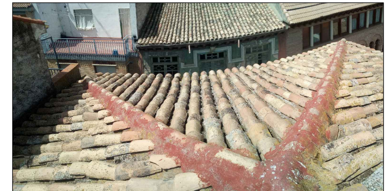
Vista cubierta a C/ Mayor