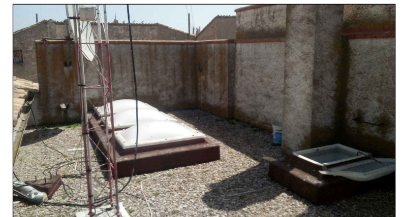
Vista cubierta plana.